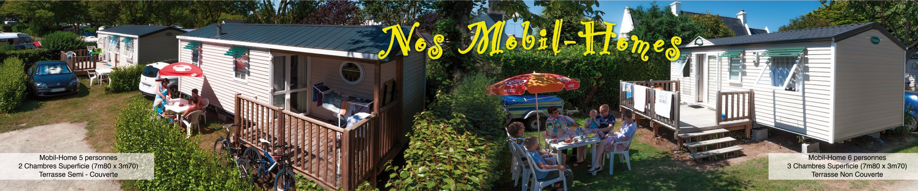
Mobil-Home 5 personnes 2 Chambres Superficie (7m80 x 3m70) Terrasse Semi - Couverte