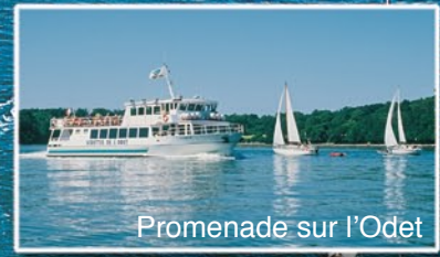
Promenade sur l'Odet